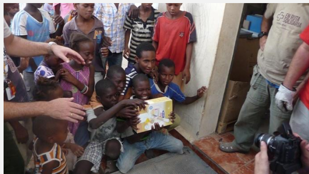
La ayuda llega donde más se necesita

Porque Disfrimur ya trabajó con la mencionada ONG, esto proporcionó un destino ya preparado para las donaciones. La empresa participó en la entrega de la ayuda en ocasiones anteriores y los conductores y personal de apoyo ya estaban familiarizados con el trabajo en Mauritania.