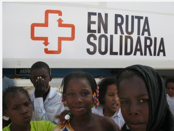
En Ruta Solidaria proporciona ayuda humanitaria en Mauritania