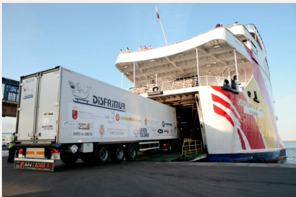
Disfrimur participó en el transporte de la ayuda